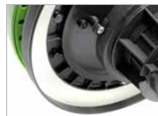
JOINT DE TÊTE NOVATEUR