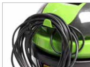
CROCHET POUR CÂBLE