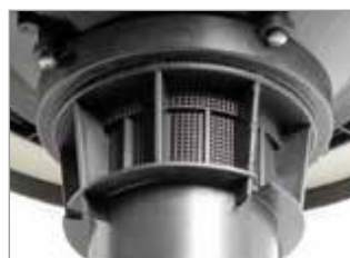
SYSTÈME ANTI-MOUSSE INTÉGRÉ